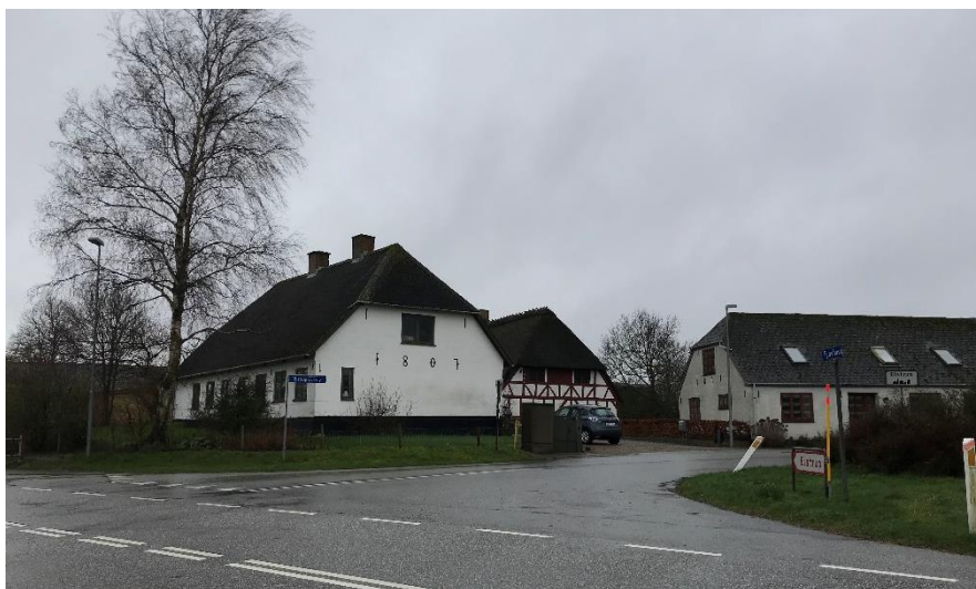
Kig til ejendommen Elstrup Overby 1, som markerer sig på hjørnet af Fynshavvej og Elstrup Overby.