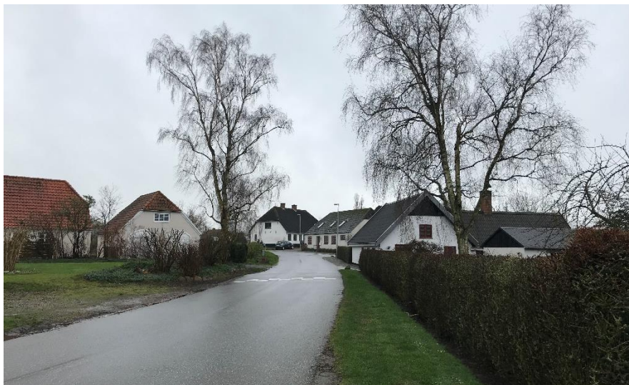
Kig via Elstrup Overby mod syd. I baggrunden ses en del af ejendommen Elstrup Overby 1.