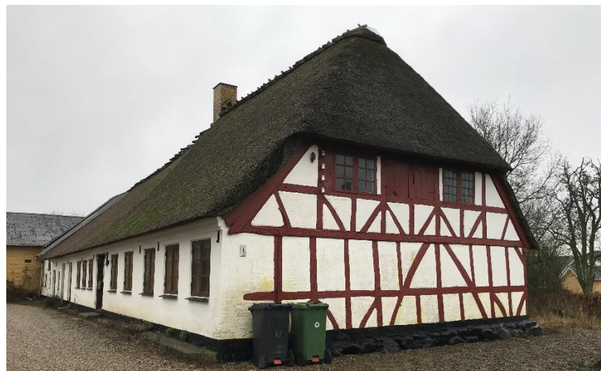
Stuehuset har høj bevaringsværdi på 3 ifølge SAVE-skalaen og er blevet omfattet af et forbud mod nedrivning efter planlovens § 14.