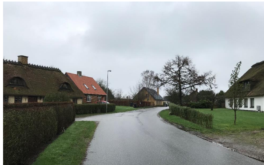
Kig via Elstrup Overby mod nord, hvor man tydeligt fornemmer det in-time og slyngede vejforløb.