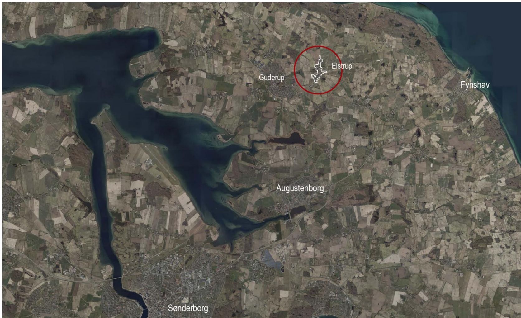
Oversigtskortet viser lokalplanområdets placering umiddelbart øst for Guderup på Midtals.

Lokalplanens placering og afgrænsning ses på kortudsnittene herunder: